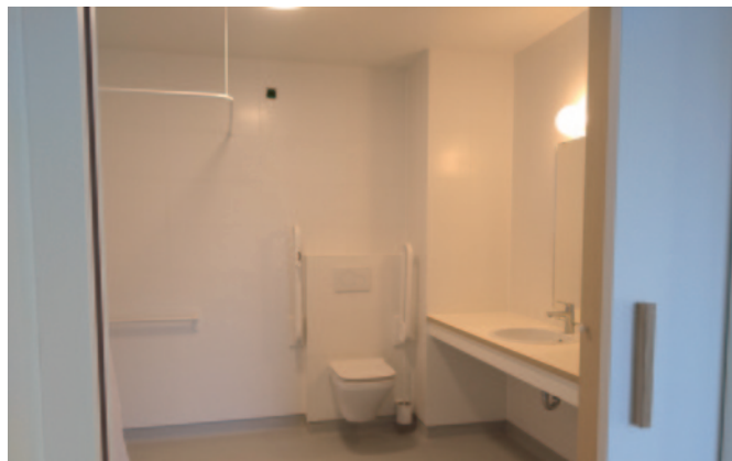
Hangtoilet voorzien van handgrepen en onderrijdbare ruime wastafel