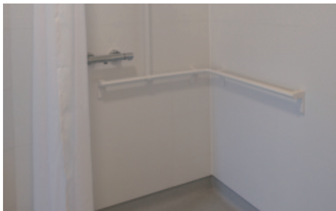
Inloopdouche met douchegordijn en handgrepen