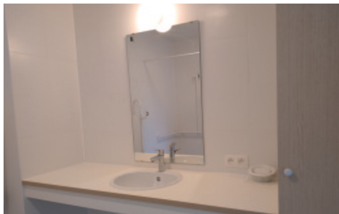
Grote wastafel met spiegel en opbergkast