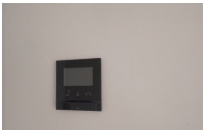
Dag en nacht hulp nabij als je in nood verkeert.